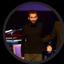
PABLO CASANUEVA: Cámara